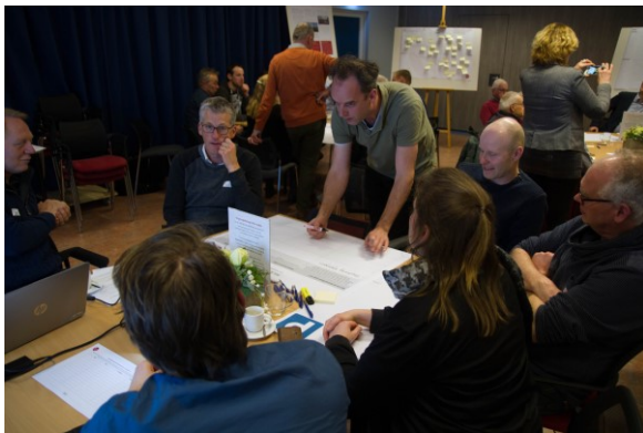
Tijdens de Omgevingsdialogen werden kwaliteiten en grote opgaven voor de toekomst besproken

Lees meer over de resultaten van de Omgevingsdialogen